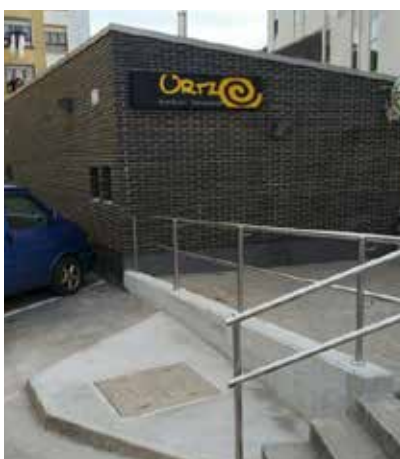
MEATZARI PLAZA / ORTZE