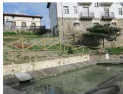
LAVADERO DE SAN JULIAN