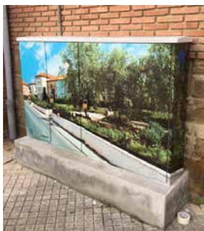
CUADRO ELÉCTRICO SAN JUAN