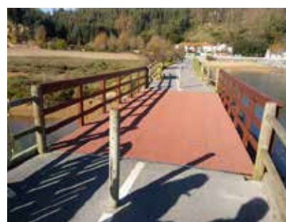
PASEO ERMITA POBEÑA