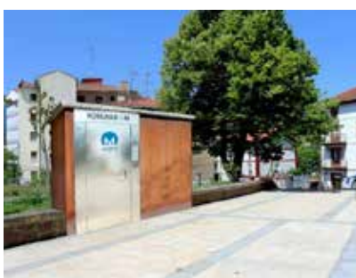
PARQUE DEL CRUCERO